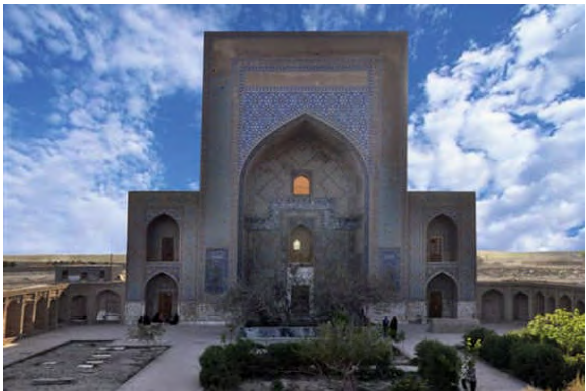
مزار مولانا زین الدین ابوبکر تایبادی (تایباد)