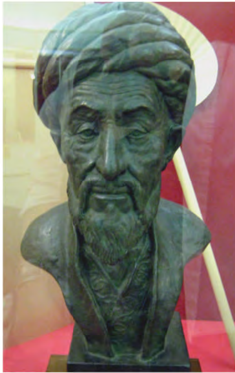
چهره بازسازی شده شاهرخ تیموری