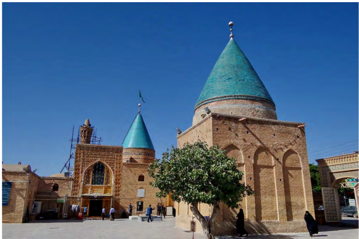
آرامگاه بایزید بسطامی (بسطام)