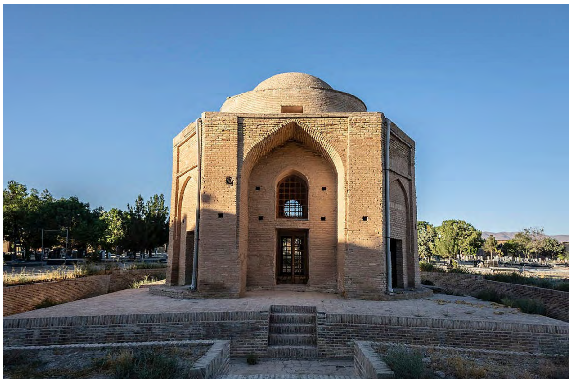
چهار طاقی (شیروان)