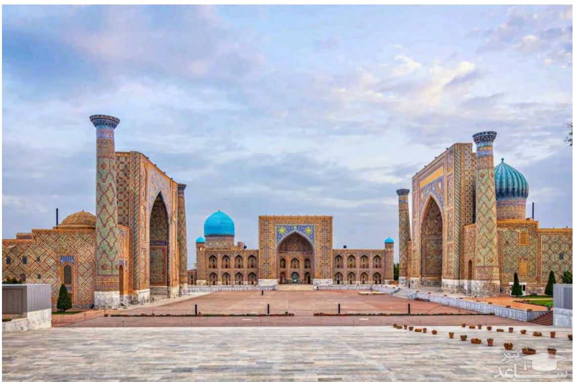
مدرسه الغ بیگ (بخارا)