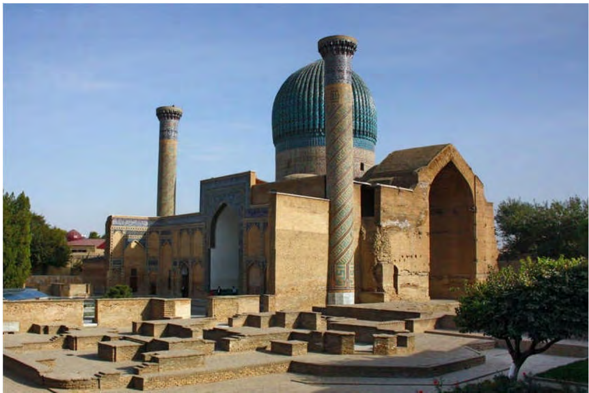
گور امیر تیمور (سمرقند)