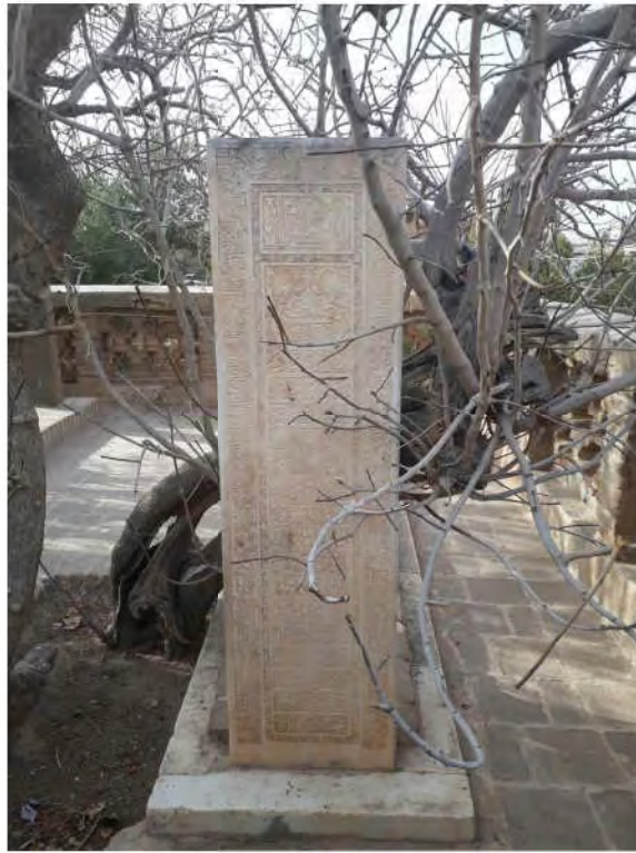
مزار حافظ ابرو (خواف)