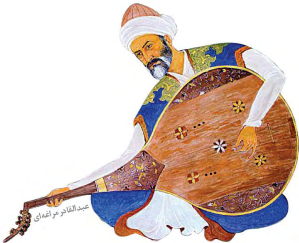
عبدالقادر مراغی - موسیقیدان دوره تیموری