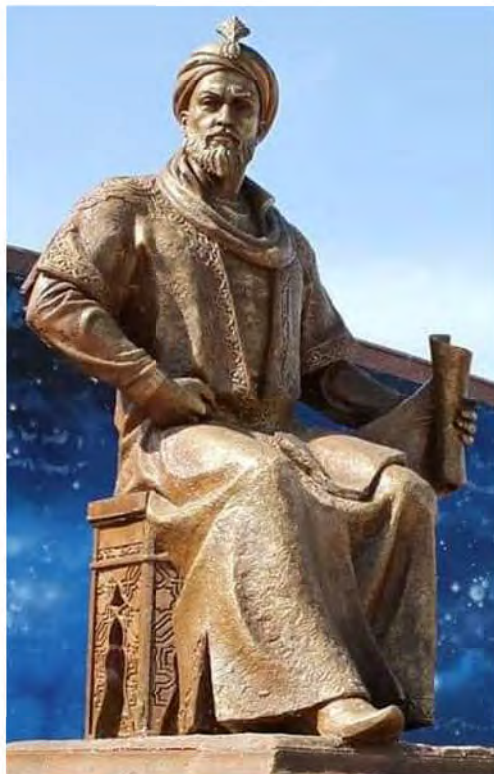
الغ بیگ (سمرقند)